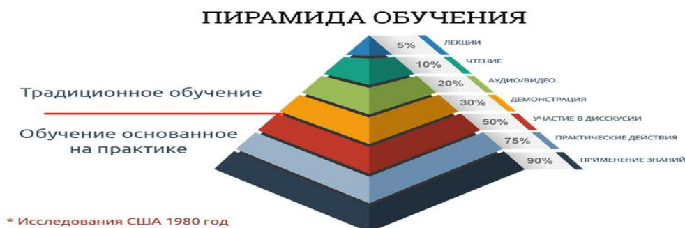
Рисунок 1 – Модель пирамида обучения, разработанная на основе исследований американского педагога Эдгара Дейла

Согласно «Пирамиде обучения», которую начали разрабатывать ещё в 70-х годах XX века, количество усваиваемой информации напрямую зависит от вида образовательного метода (рисунок 1).