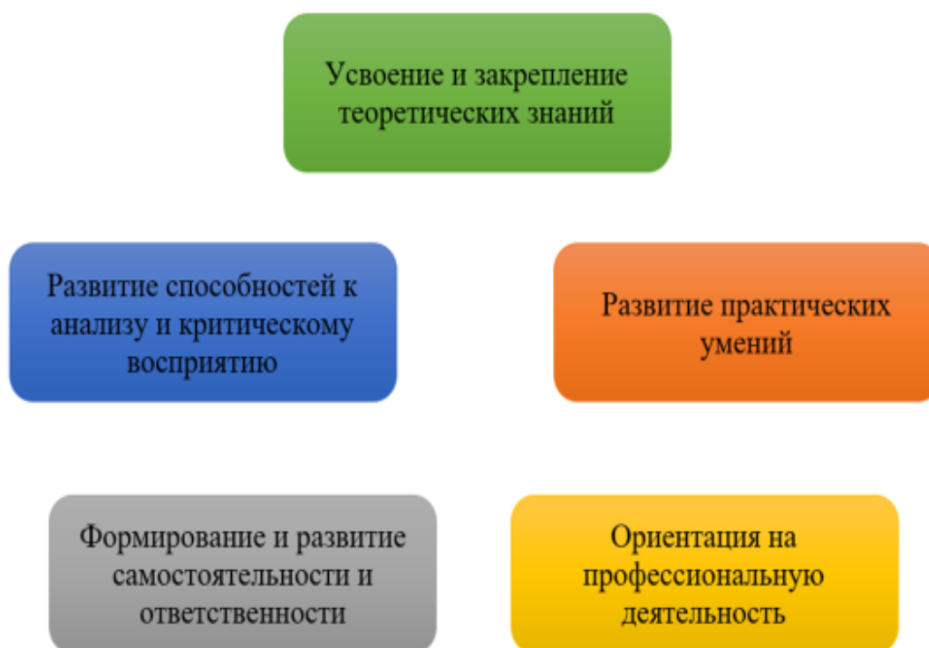
Рисунок 2 – Основные цели занятий

При выполнении практических задач учащиеся осваивают навыки анализа данных, формулирования выводов и поиска.